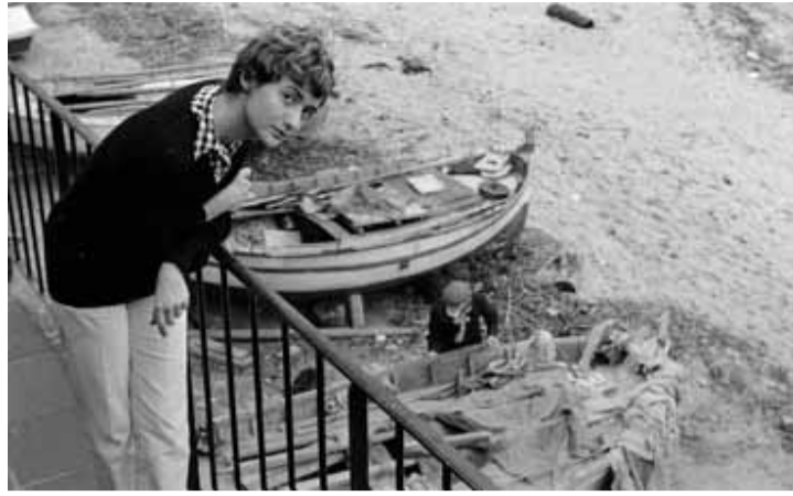
LA ESCRITORA francesa Françoise Sagan.