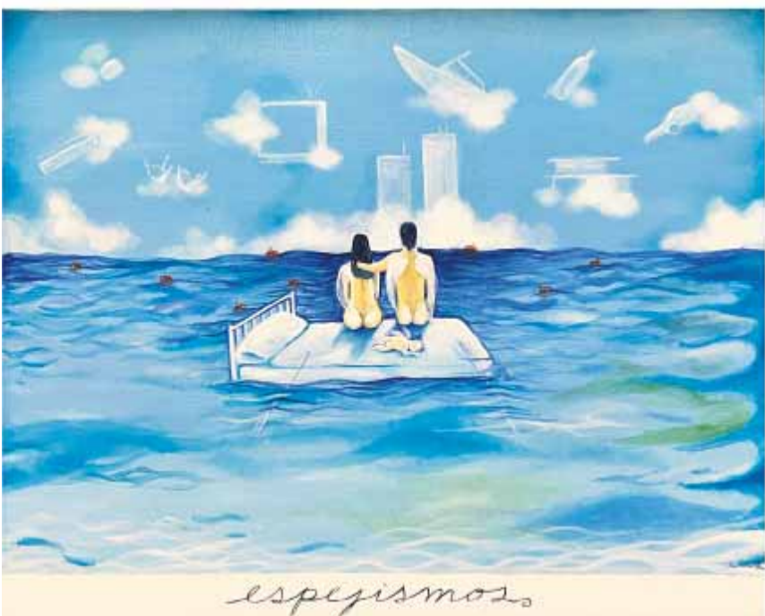
'ESPEJISMOS', 1994, de Sandra Ramos en Pan American Art Projects, Art Miami.